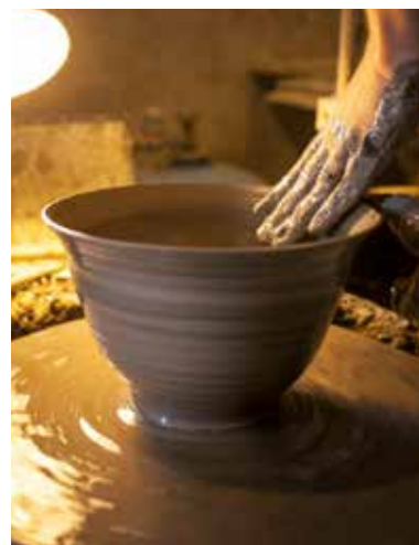
Artisanat local – Petite montagne