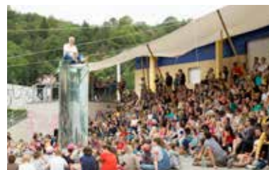
Festival Idéklic 2019 – Jura Sud