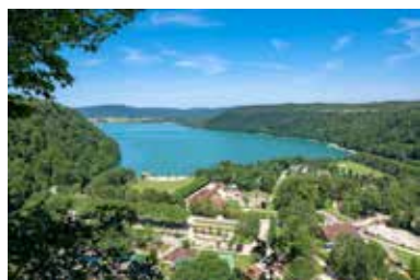
Lac de Chalain

Afin de permettre à chacun de s'impliquer, la nouvelle communauté de communes a choisi de se doter d'un nouveau fonctionnement dans lequel chacun pourra s'impliquer :