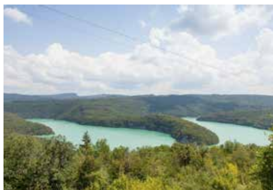
Lac de Vouglans

* 1 commune ne souhaitant pas se prononcer est considérée comme favorable