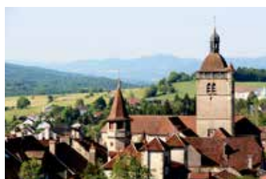
Orgelet – Centre bourg

Le nom de la future intercommunalité sera choisie lors de la conférence des maires prévue le 5 décembre.