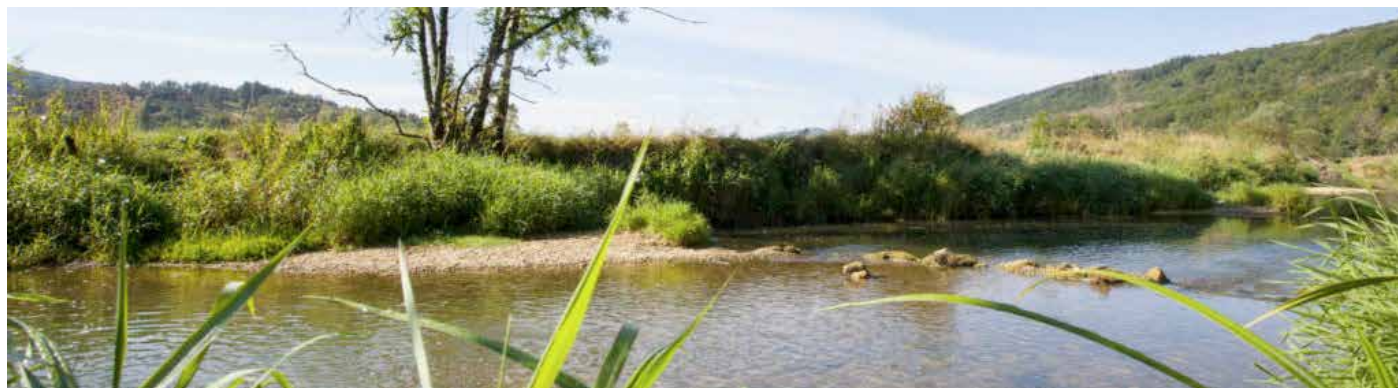
Le Suran – Petite Montagne