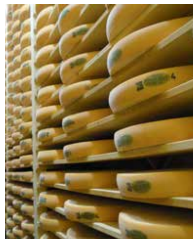
Le comté, produit de notre territoire