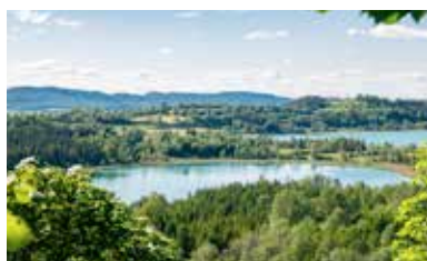
Belvédère de la Scie – Soucia