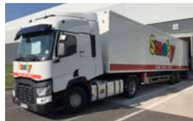
Smoby – Moirans-en-Montagne

Au programme, partager et s'appropriier l'ensemble des actions en cours à l'échelle de la nouvelle communauté de communes et préparer l'harmonisation en matière d'actions et de budgets.